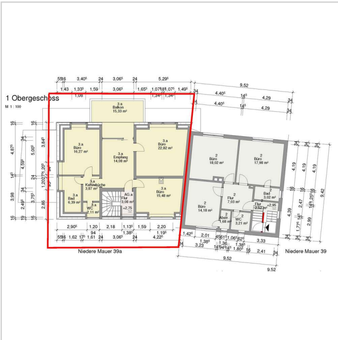
NM_39_a_Büro_1.OG - LINKS