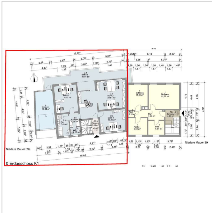
NM_39_a Büro_23-01-16 EG - Li