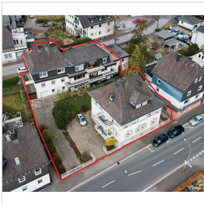
Luftaufnahme rote Markierung