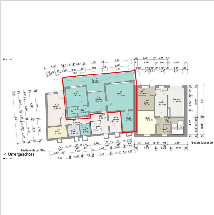
NM_39_a Büro_23-01-16 UG - EG

Miet-/Kaufobjekt: Miete Büro-/Praxisfläche: 330,00 m 2 Miete pro m 2 : 11,00 EUR