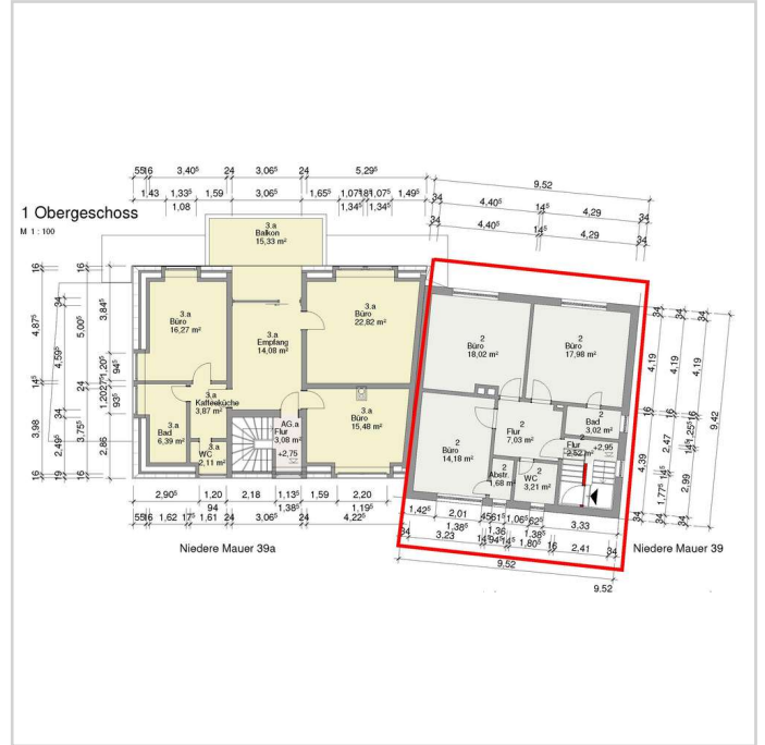
NM_39_Büro_1.OG - rechts